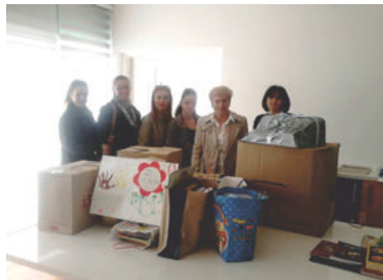
Veliko hvala mališanima i njihovim vaspitačima iz dječjeg vrtića "Princeza Katarina Karađorđević" Laktaši na donaciji za djecu koja su smještena u Roditeljskoj kući "Iskra".

Povodom Svjetskog dana pošte, osim manifestacije u Bijeljini, rukovodstvo „Pošta Srpske“ posjetilo je u Banjaluci Roditeljsku kuću za djecu oboljelu od malignih oboljenja i tom prilikom predstavnicima Roditeljske kuće, poklonjene su klupe i poštansko sanduče. Ove godine "Pošte Srpske" nisu izrađivale reklamni materijal povodom 9. oktobra, stoga su sredstva usmjerena na pomoć mališanima. U dogovoru sa predstavnicima Roditeljske kuće, kao i Udruženja roditelja za djecu oboljelu od malignih bolesti „Iskra“, naši radnici napravili su ono što je bilo neophodno, a to su klupe u dvorištu objekta u kojem borave mališani.