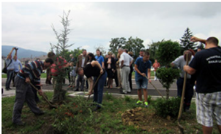
18. avgust 2016 - SNSD-ovci sadili ukrasno bilje u dvorištu Roditeljske kuće