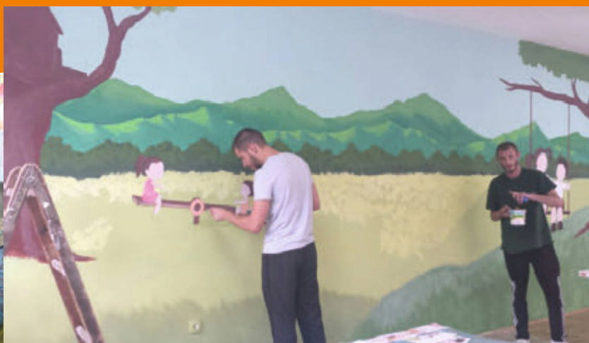
Umjetnici iz UDAS-a oslikavaju zidove dnevnog boravka Roditeljske kuće